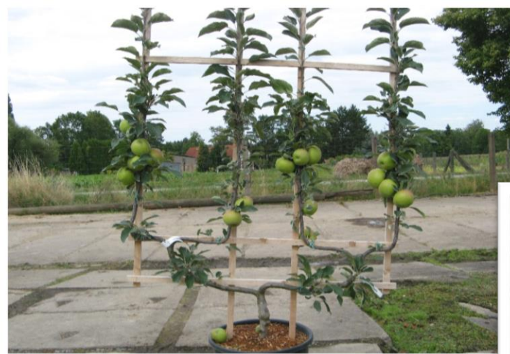
Apfel am Doppel U-Spalier

baum/schulen Oberdorla GMBH ...die beste Schule für Ihr Obst